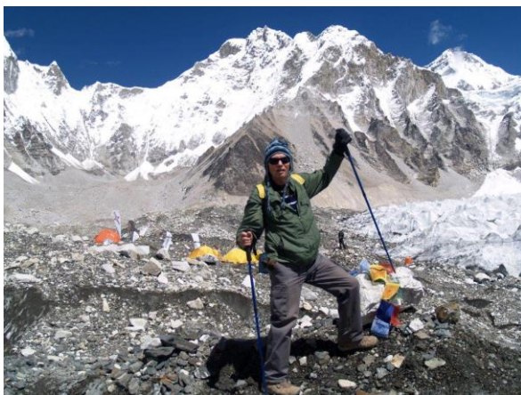
הגענו לביס קמפ

1. משך הטיול 21 יום והינו חוויה נפשית וגופנית גם יחד. נהנה מהנופים הקסומים של הרי ההימליה ומהפסגות המושלגות המתנשאות עד 8,848 מטר. בטרק נגיע עד לגובה של 5,545 מטר. המרתק הוא: המסע במדרונות ההרים בינות לכפרים שלווים, ההתרגשות מההוד של הפסגות המושלגות, המסתורין של יערות הגשם, הנוף הצחיח בגבהים, השקט בהרים, שפעת הצומח ומשק המים. ניפגש עם הנפאלים החביבים ובאתרי מורשת עולמית נכיר את תרבותם. שילוב מדהים זה יוצר חווית מסע שתיזכר לתמיד.