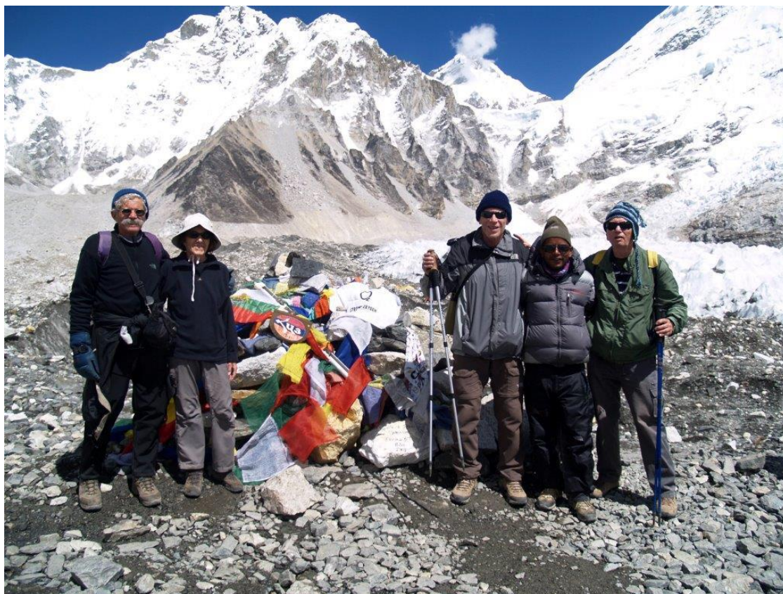
אוהלי הבייס קמפ מאחורינו

הטיול טרק יתקיים במתכונתו הנוכחית ברישום של 12 משתתפים לפחות.