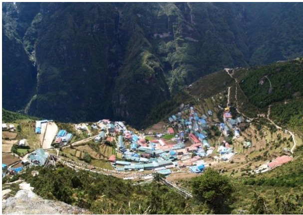
נמצ'ה באזאר 3,440 מטר

כמו ב"נמצ'ה באזאר", יום זה מיועד להמשך הרגלת הגוף לגבהים. ההליכה באותה רמת גובה.