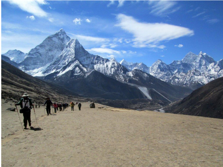
רמת טוגלה 4,600 מ'