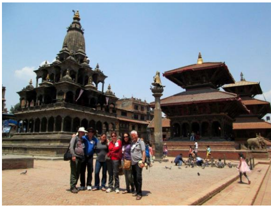
בכיכר המרכזית ב"פאטאן"