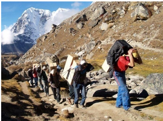
אספקה באחריות 5,000 מטר

היום מיועד להרגלת הגוף לגבהים ובהתאם נלך ל"סיאנג בוצ'ה", לתצפית ממלון "אוורסט ויו", 3,620 מ'. נשהה בעמדת תצפית נהדרת על הרי ההימליה. נבקר במוזיאונים, "אוורסט" "חיי שבט השרפה" ו"טבע בהימליה". שם נראה את פסל ים המלח סמל לידידות נפאל-ישראל. אחר הצהריים שיטוט חופשי בעיירה ובשוק הצבעוני. העיר היא בירת המסחר והמנהלה של מחוז "חומבו".