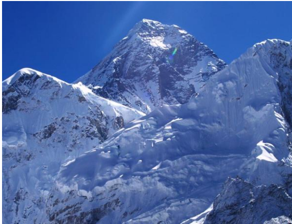
ה"אורסט" ממרחק 9.5 ק"מ

בטרק זה, הנוף המדהים, החוויות הרגשיות והמסעירות, האתגר העצום והמפגש עם התרבות המקומית מפצים על כל המאמצים והחוויה היא חד פעמית ובלתי נשכחת.