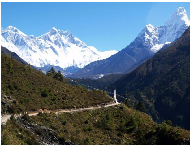
האורסט ממרחק 40 ק"מ

יום 20.21. עד הצהרים זמן פנוי להריח ולטעום פעם אחרונה מקטמנדו ומנפאל. אחר הצהרים המוקדמים טיסה לתל אביב ולמחרת בבוקר נחיתה בישראל.