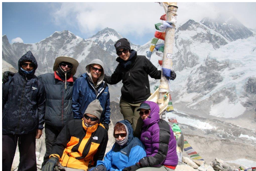
ב"קאלה פאטאר" 5,545 מטר

שתייה בזמן הארוחות, כביסה, שיחות טלפון, קניות אישיות וכל שימוש או צורך אישי אחר. הוצאות נוספות כגון, לינות, ארוחות נוספות בקטמנדו ו/או בהרים, או כל הוצאה שהיא עקב יציאה ו/או חזרה מוקדמת או מאוחרת מקטמנדו לטרק ומהטרק לקטמנדו מכל סיבה שהיא.