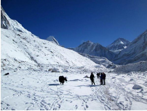
בדרך ל"בייס קמפ" 5,250 מ'

יום 8. הליכה מ"נמצ'ה באזאר" ל"טנגבוצ'ה" 3,867 מ', 6-7 שעות.